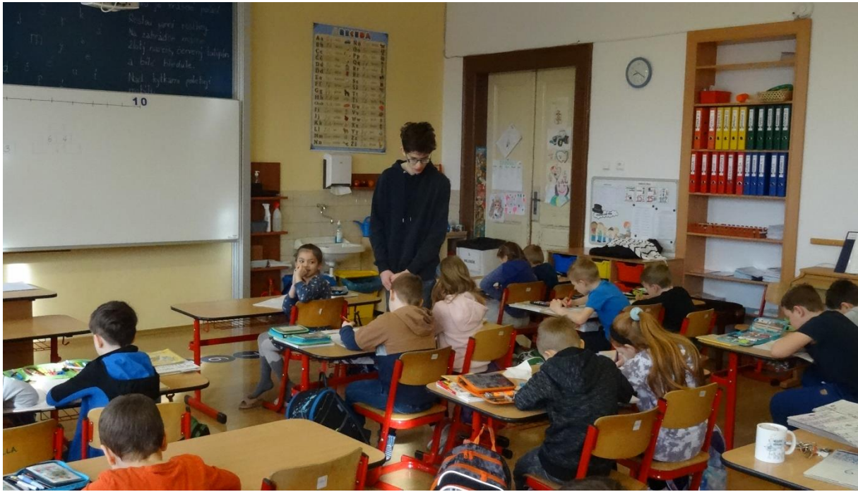
Den naruby – 27. 3. 2024