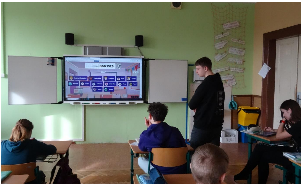
Den naruby – 27. 3. 2024