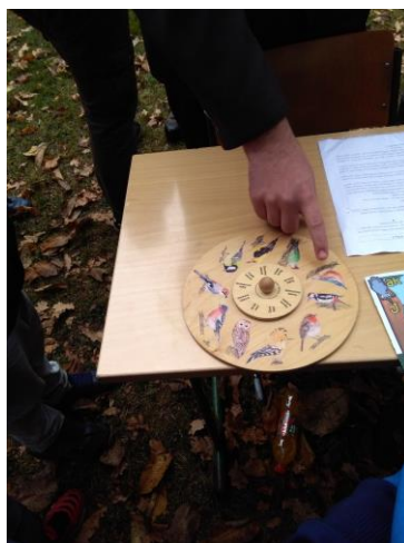
R. Ladická - 4. třída