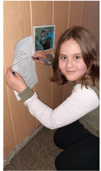
Tabulka základních znaků morseovky včetně pomocných slov